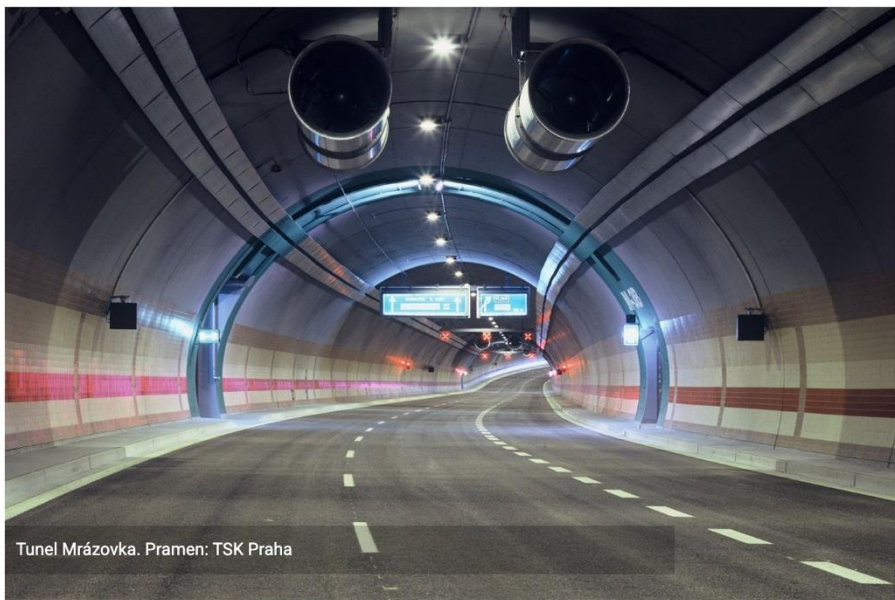
Tunel Mrázovka.