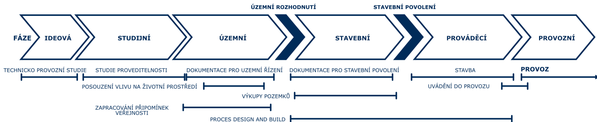
Schéma procesu přípravy Správa železnic